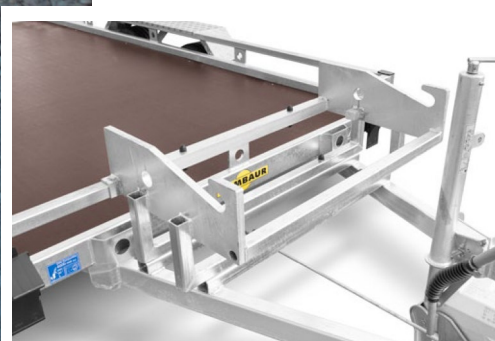
Baggerschaufelablage auf V-Deichsel (optional)