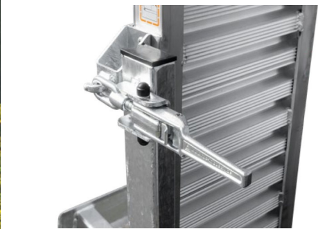
Optimierte, verstellbare Spannverschlüsse mit Gummipuffer